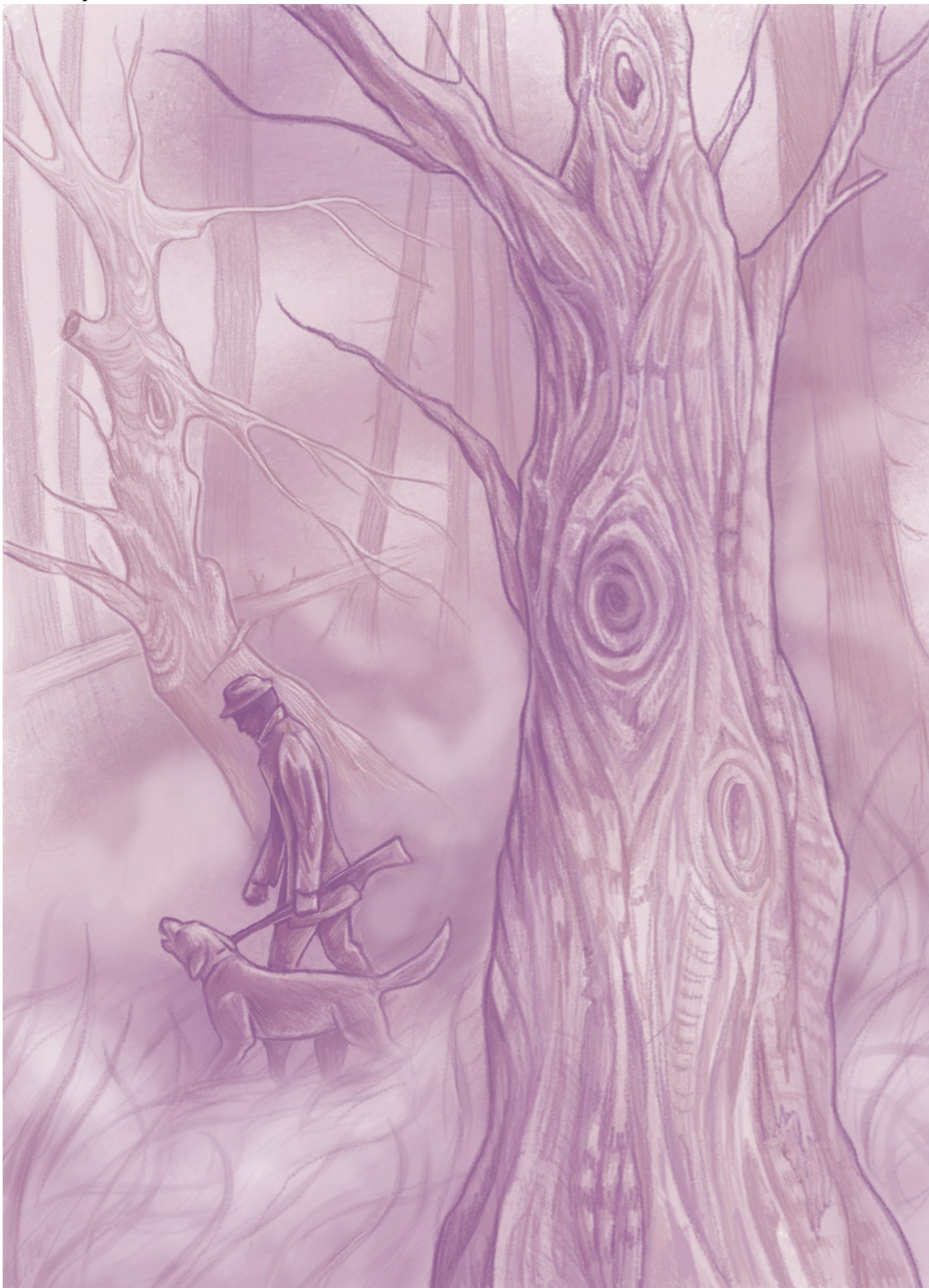
Ilustrace: Aneta Šleglová